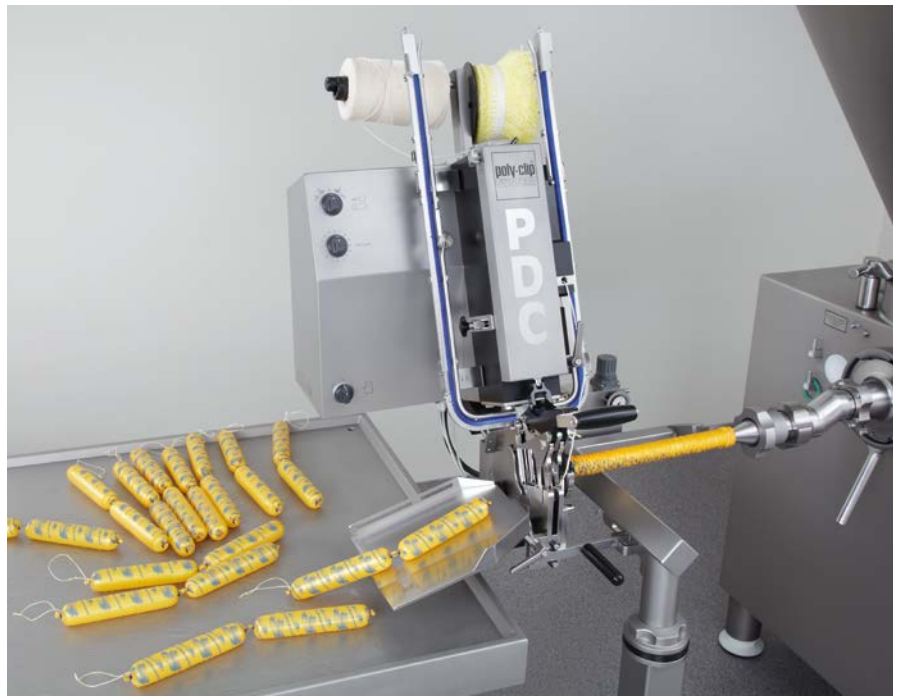
La PDC 600 permite producir de modo fiable y rápido embutidos con calibres de hasta 90 mm