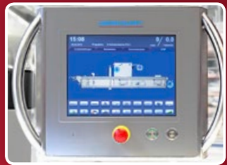
Modo de operación en más de 25 opciones idiomas

Diseño de líneas suaves que caracteriza la siguiente generación de máquinas de empaque